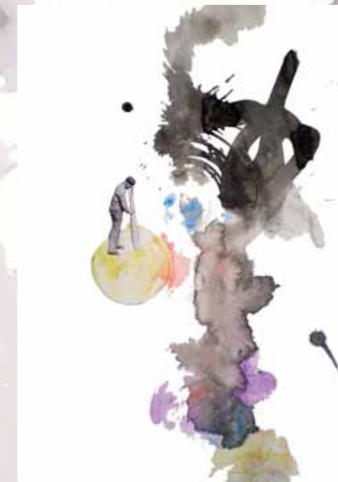
Untitled. 2009. Técnica mixta (detalle). 100x80 cm

La Memoria se refiere a la facultad psíquica por medio de la cual puede retenerse y recordarse el pasado. Es una disertación escrita o un estudio sobre alguna materia. La Plástica , en cambio, es el arte de plasmar un conjunto de cualidades de una obra que la hacen expresiva.