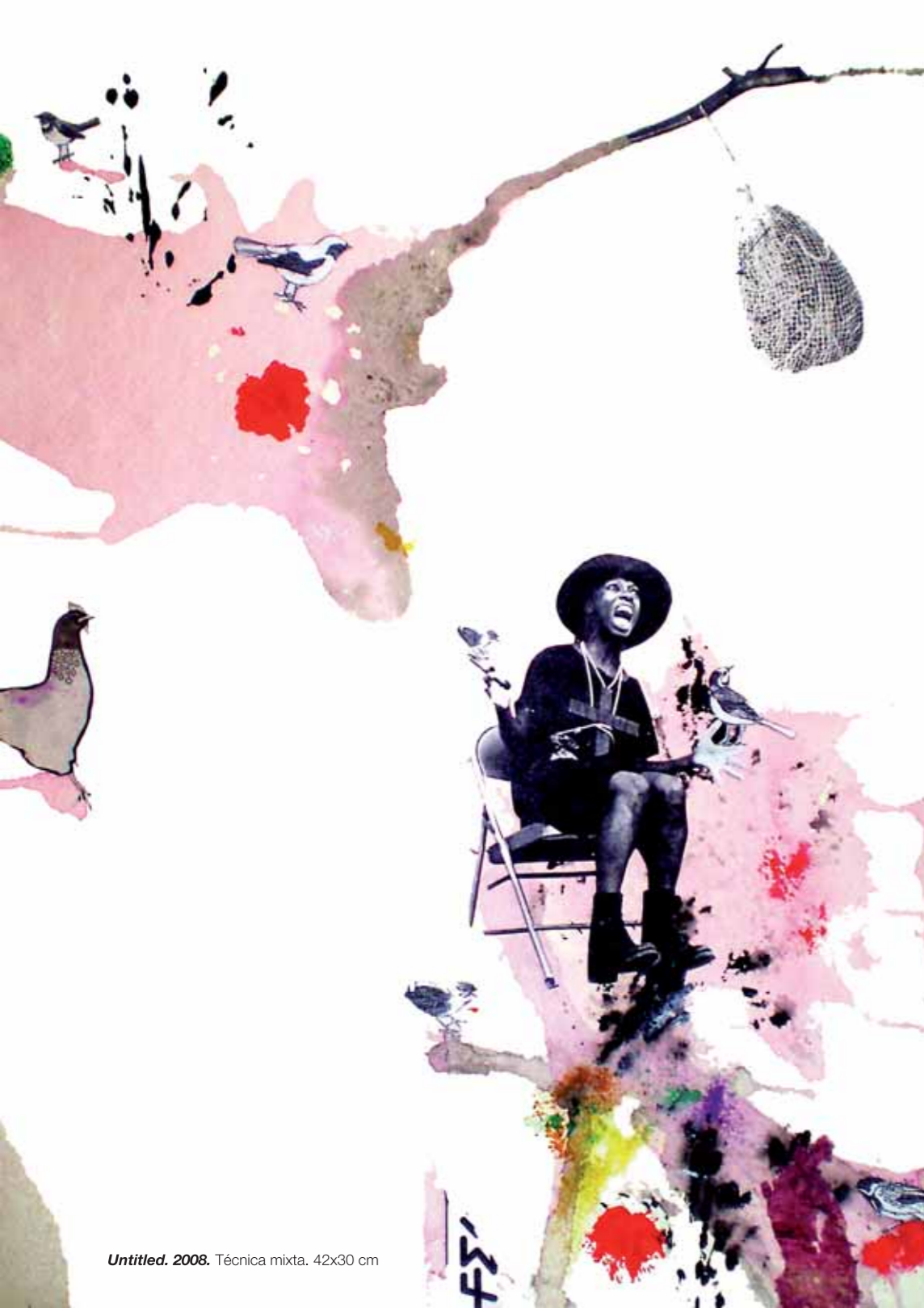
Untitled. 2008. Técnica mixta. 42x30 cm