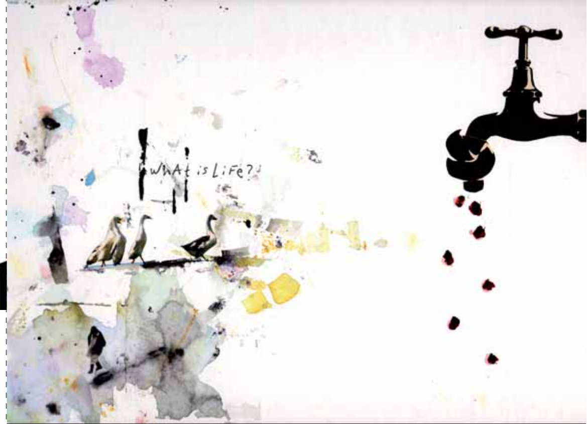
What is life. 2009. Técnica mixta. 120x90 cm

Del 4 de noviembre al 3 de diciembre de 2009