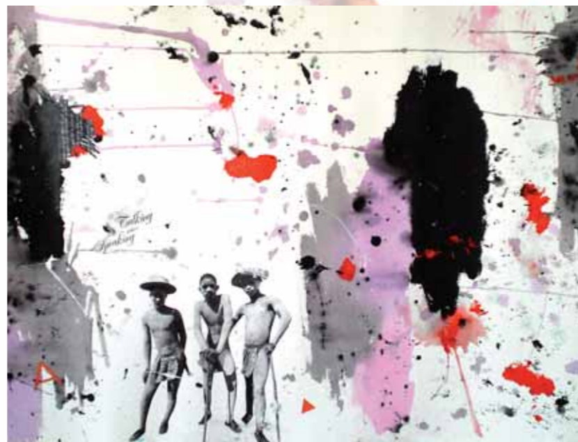
Talking without speaking. 2008. Técnica mixta. 100x70 cm

La vida está compuesta por elementos cotidianos, pero a su vez por infinidad de factores intangibles, como la imaginación. La técnica del collage me sirve como método para la expresión de los temas, como una aproximación al contenido de las historias. Son un reflejo de mis vivencias, críticas sociales o guiños de humor.