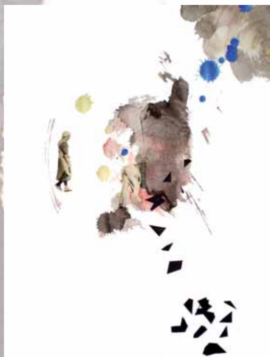
Amama. 2008. Técnica mixta (detalle). 100x80 cm

Esta obra incorpora el lenguaje y la imagen como medios de comunicación y artístico. Mi personal universo creativo combina una línea estética de profundidad emotiva y conceptual y una atmósfera temática donde la poesía forma parte de la plástica constituyendo un todo visual.