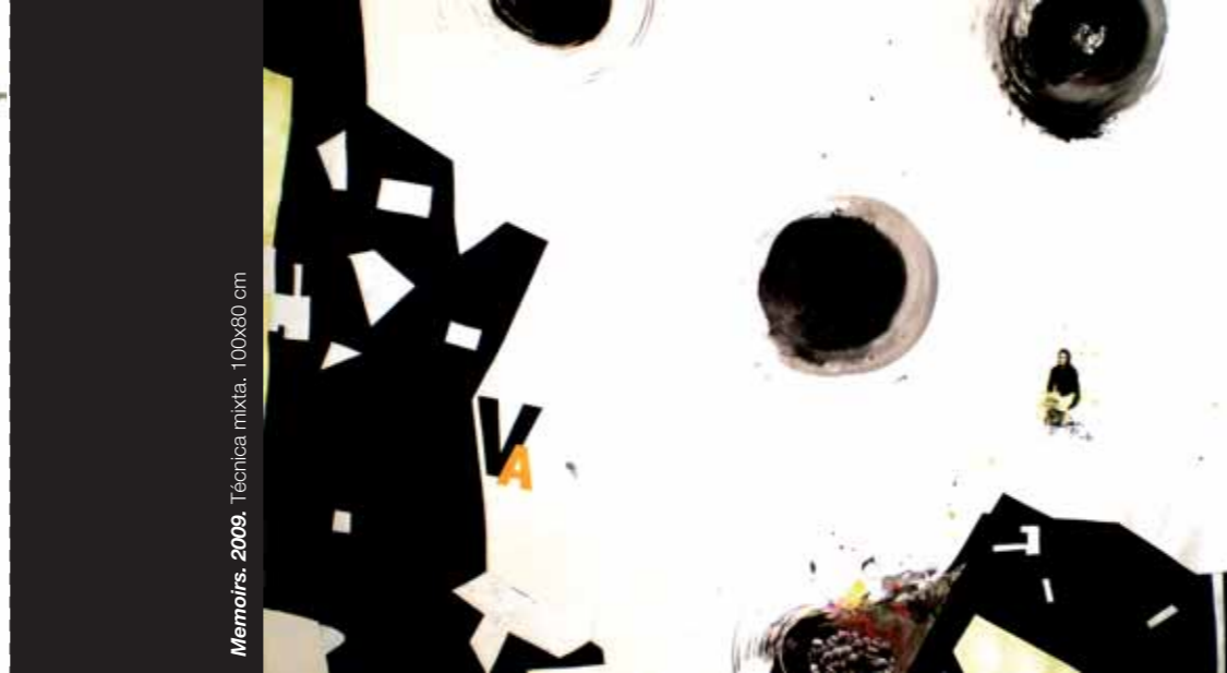
Memoirs. 2009. Técnica mixta. 100x80 cm